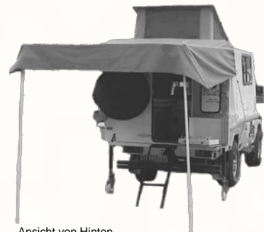
Ansicht von Hinten

Weitere Mietfahrzeuge und Fahrzeugbeschreibungen sowie aktuelle Spezials finden Sie im Internet unter: www.nature-trekking.de