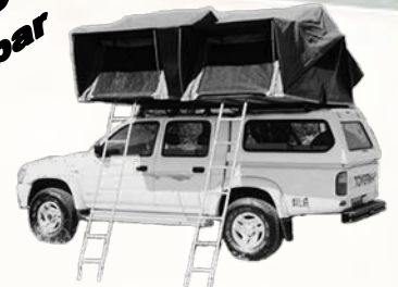
4 x 4 Camper Double Cab

für Reisen nach Namibia, Botswana, Südafrika, Zambia, Zimbabwe, Mocambique